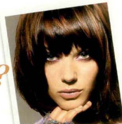
BALAYAGE EFFET "LOUNGE"

La réponse du coloriste : faites-lui confiance s'il vous dit qu'il ne pourra pas obtenir ce blond très clair en une seule fois. C'est uniquement par souci de ne pas abîmer vos cheveux. À la première séance, il obtiendra un blond clair (cendré ou doré) avec un éclaircissement de deux à trois tons. Et à la deuxième séance, il obtiendra le blond très clair désiré. Seul un pro peut réussir ce genre d'opération, tout en essayant de ne pas aggraver la sensibilisation de votre cheveu.